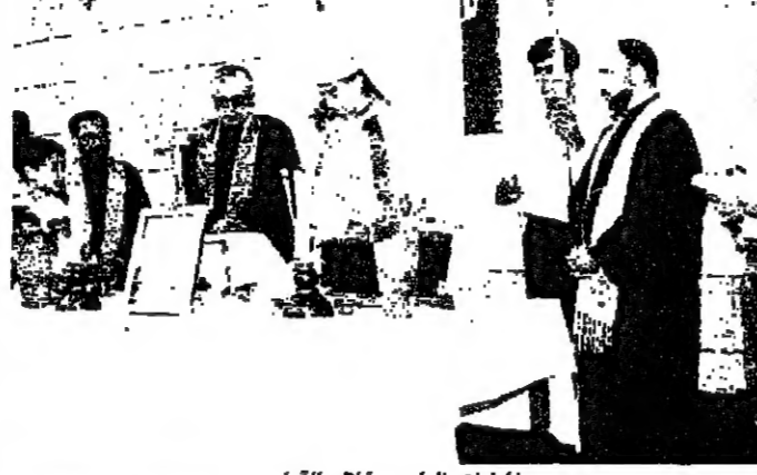
المطران الراعي خلال القداس

اجتمع في مجدل العاقورة في بلدة العاقورة جنوب شرق بيروت من اجل صلاة القداس التي أقامها المطران الراعي اسكندر غبريل في رعية العاقورة.